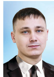
Фото из личного фотоальбома

Исполнительный редактор Р. М. Уразгильдин