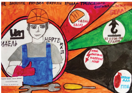
Рис. Плетнева Алексея