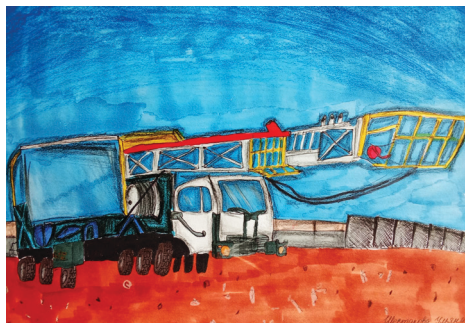
Рис. Шестаковой Ульяны